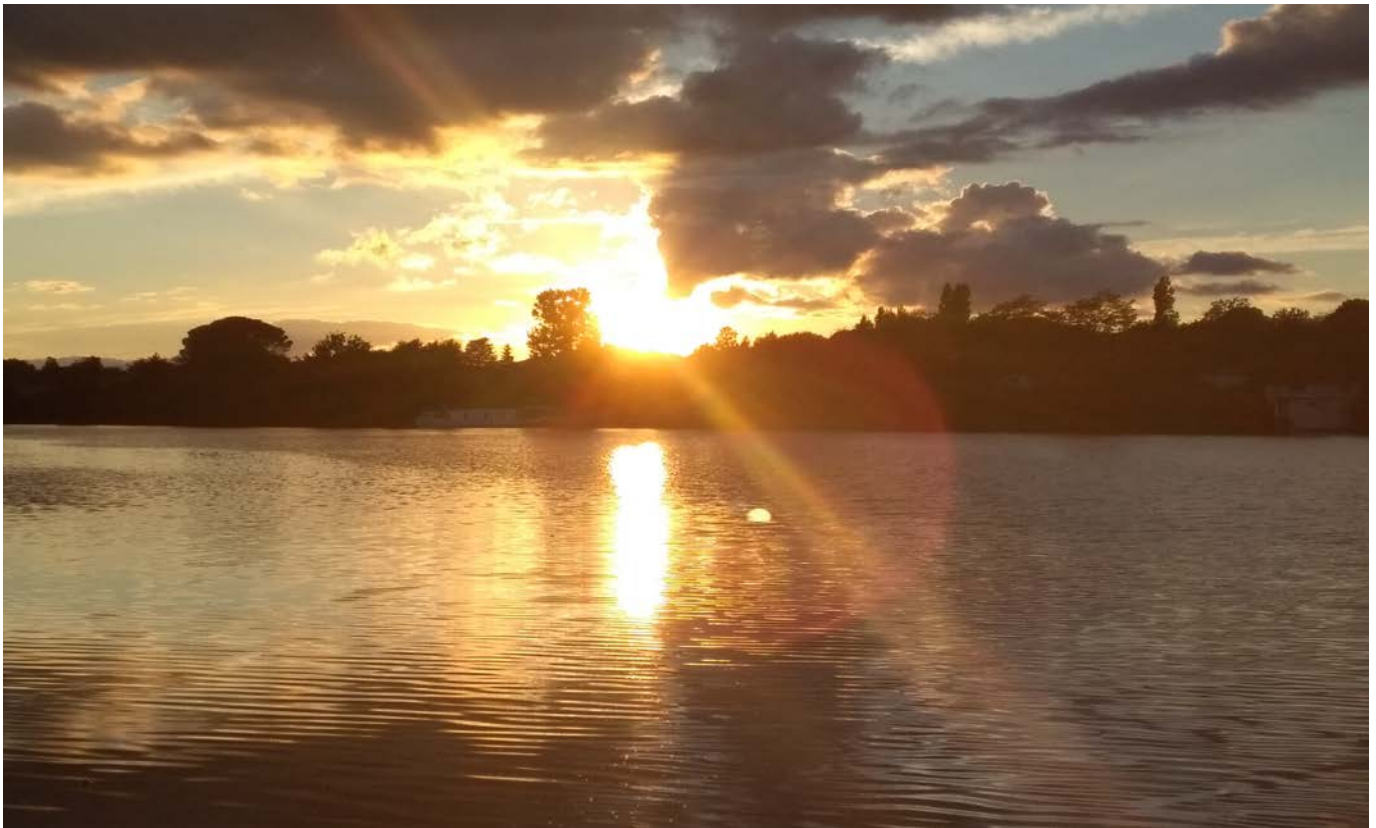
Lever et coucher de soleil à Casseneuil